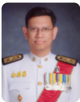
รังสิชัย บรรณกิจวิจารณ์ (๑)

ผู้เลี้ยงดูให้อาหารสุนัขจรจัดอย่างเป็นเจ้าของ ย่อมต้องรับผิดชอบ ทั้งทางอาญาและทางแพ่งในความเสียหายอันเกิดจากสุนัขจรจัดนั้น